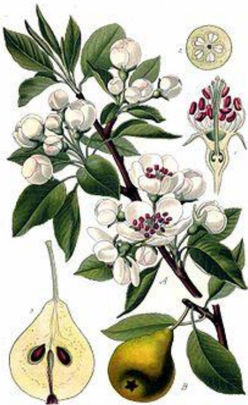
Pl. III. Poirier commun. Pirus communis L.