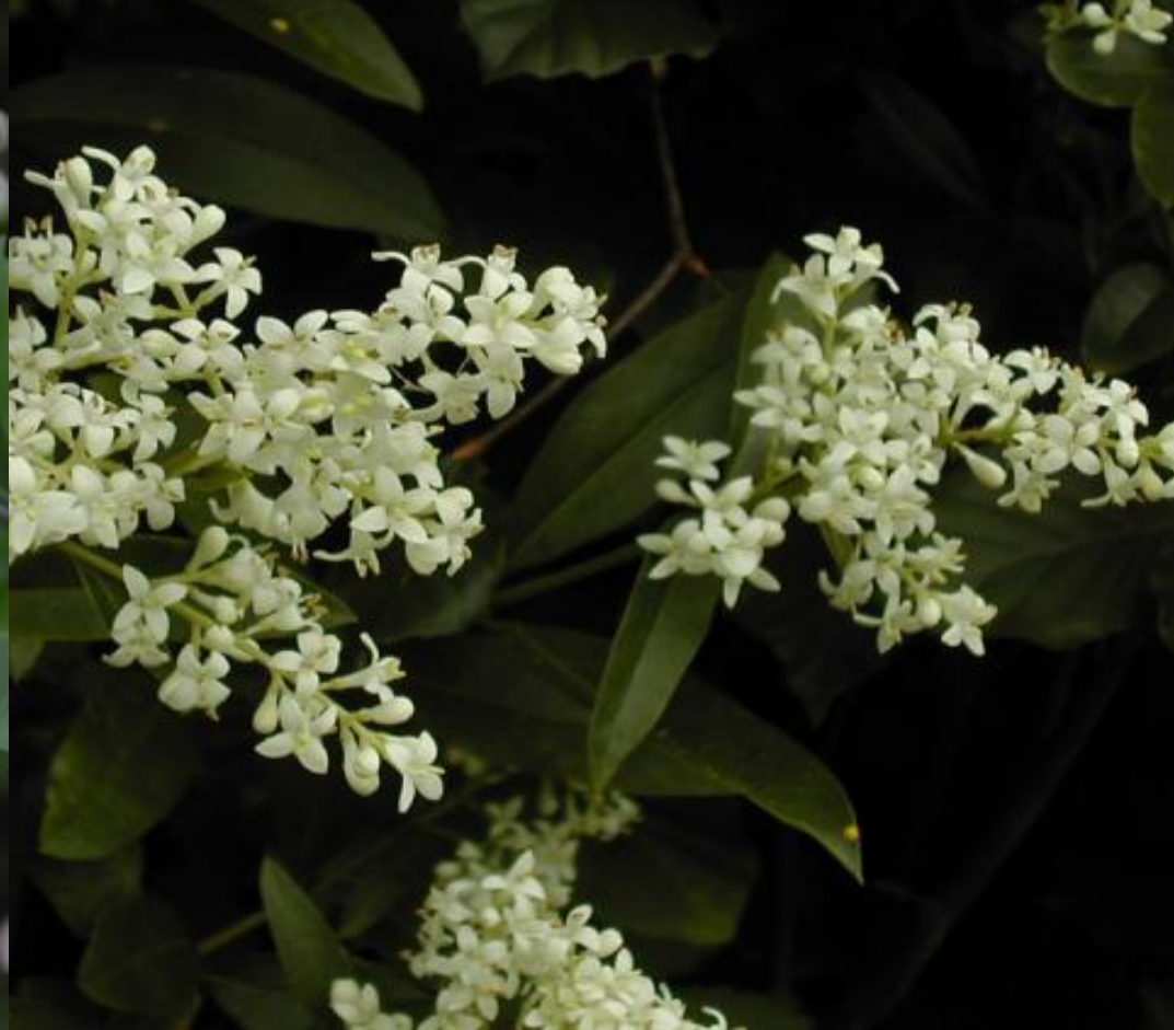
PTAČÍ ZOB VEJČITOLISTÝ