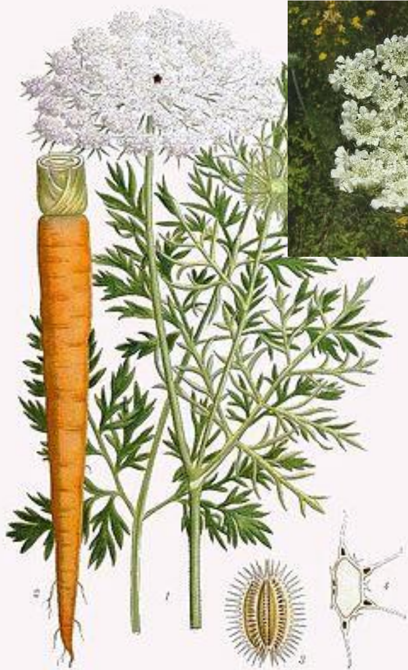
MORŮT. DAUCUS CAROTA L.