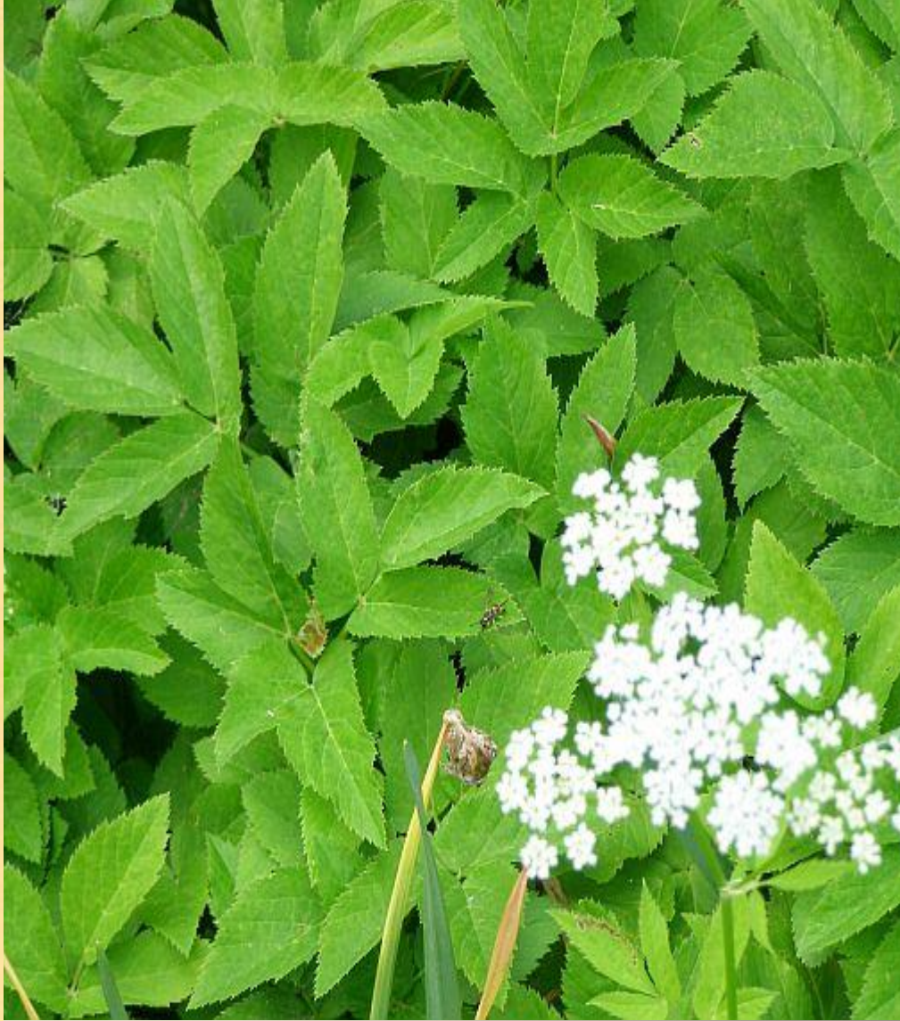
BRŠLICE KOZÍ NOHA