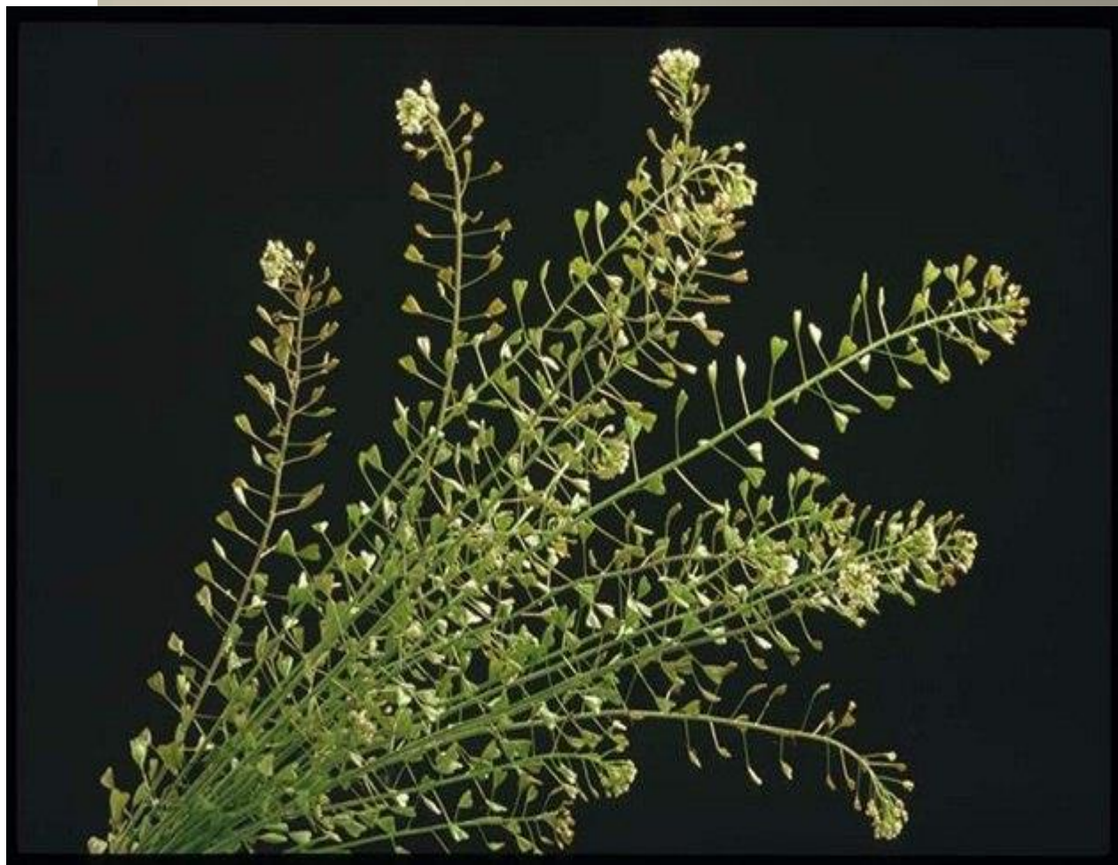
KOKOŠKA PASTUŠÍ TOBOLKA