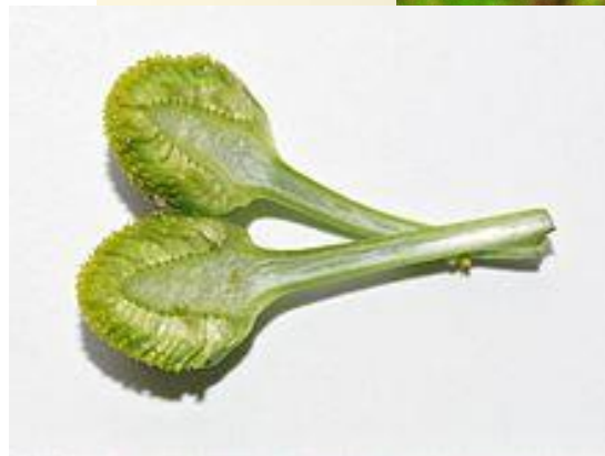
HEŘMÁNEK CIZÍ - TERČOVITÝ